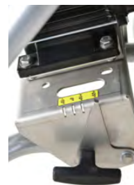
Tirador para ajustar el ángulo de inclinación